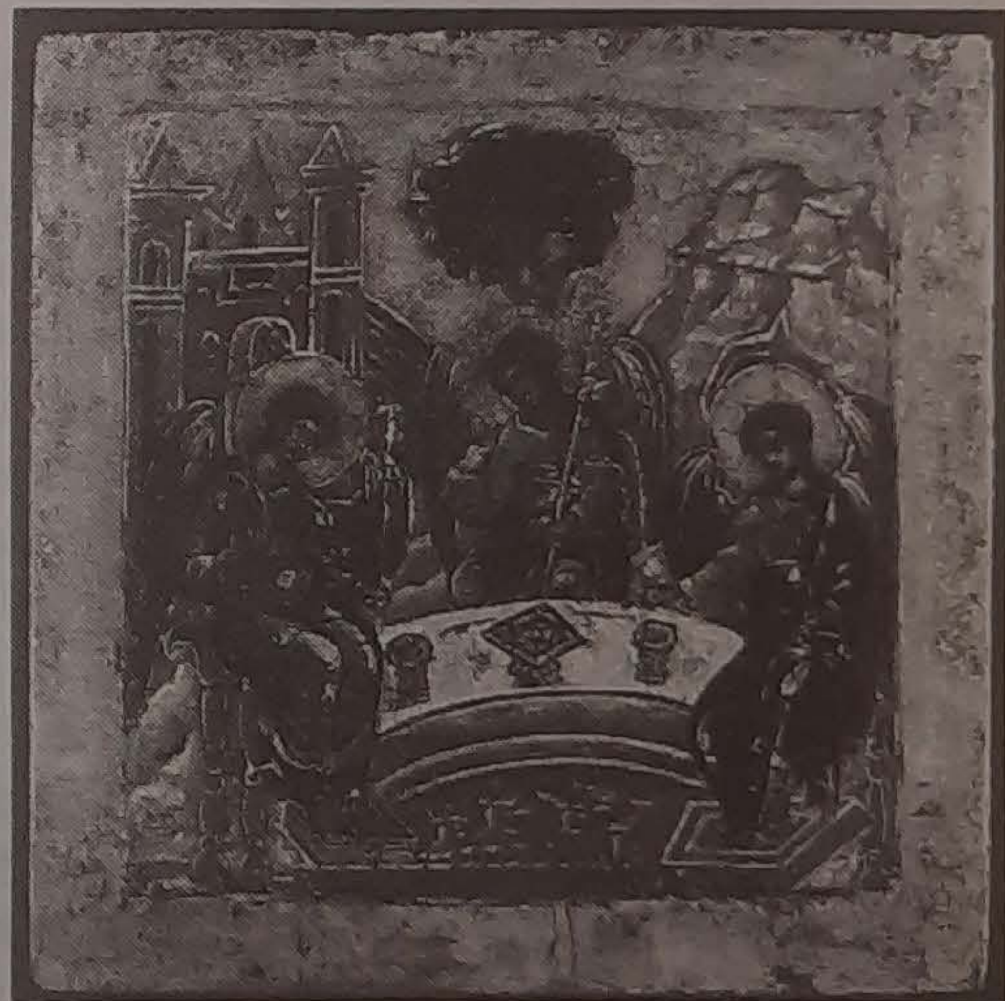
De Triniteit, 16e eeuws Noord Rusland