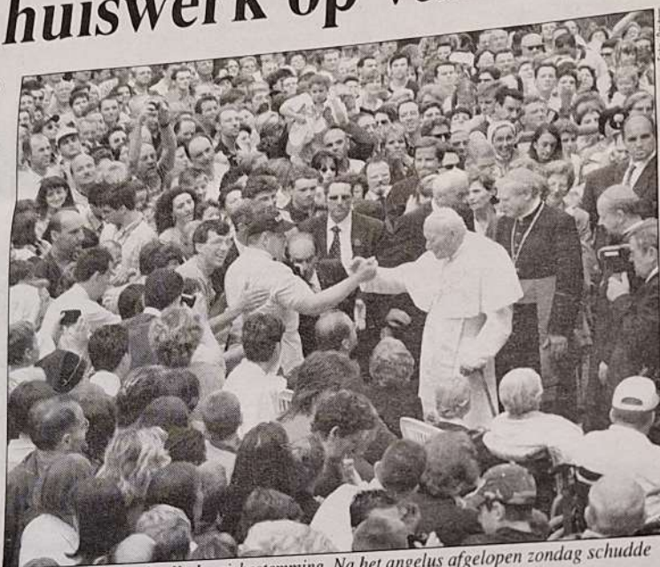
Paus Johannes Paulus II als reisbestemming. Na het angelus afgelopen zondag schudde de paus menige hand.

Paus Johannes Paulus II is op vakantie in de Dolomieten. Veertien dagen rust, voordat het hectische leven weer begint. Toch heeft de paus niet alleen zijn wandelschoenen ingepakt, maar ook de voorlopige versies van enkele belangrijke documenten.