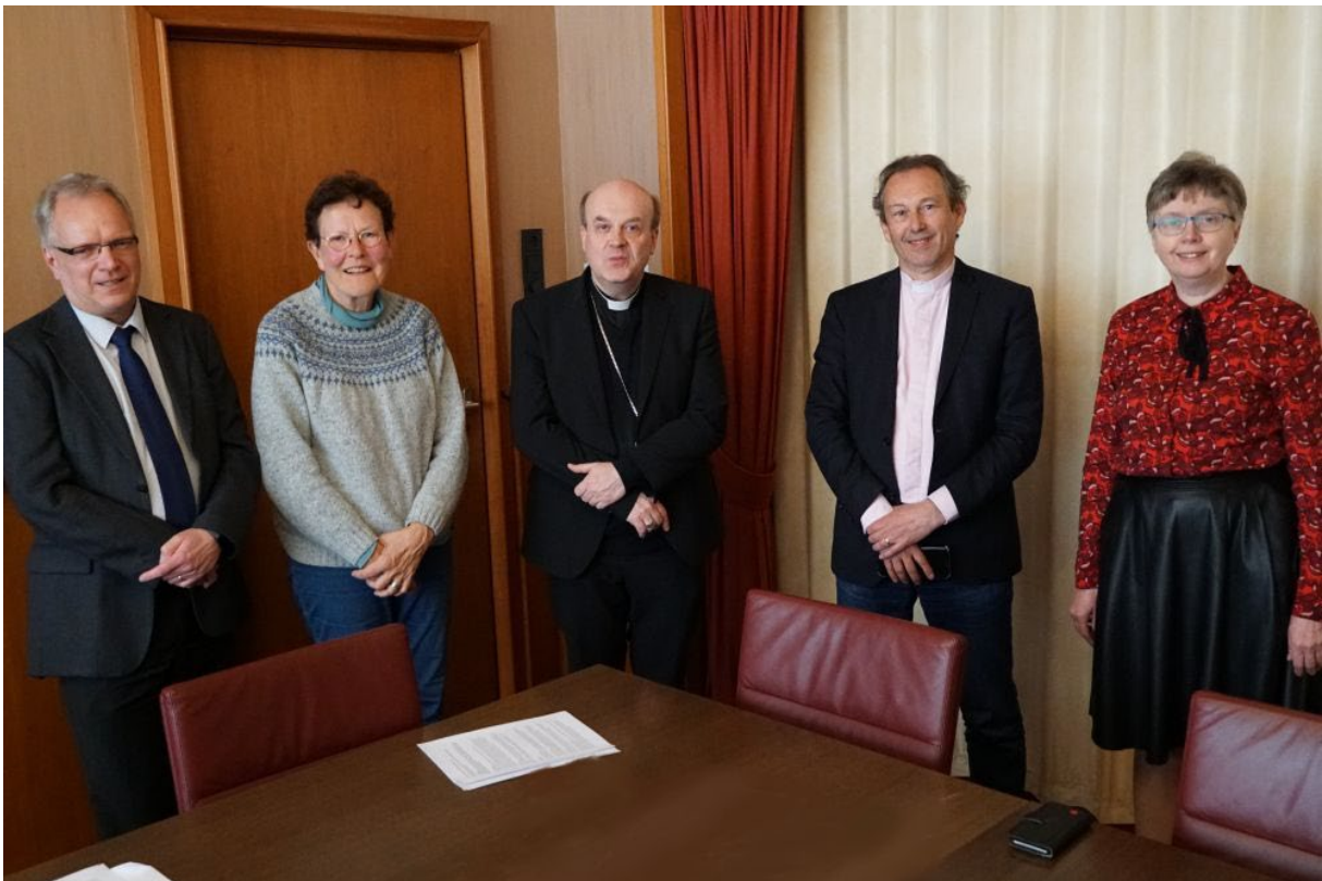
“Voor een synodale Kerk” - Oecumenische gesprekken (29 maart 2022)