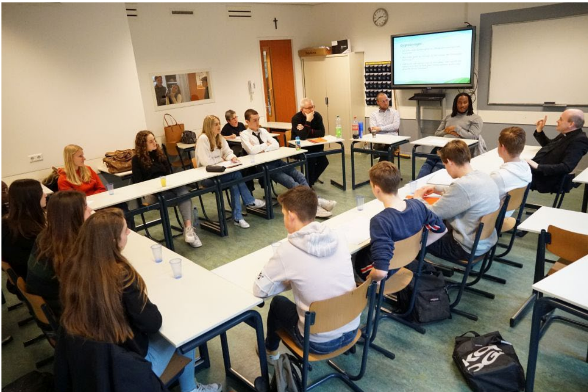
“Voor een synodale Kerk” - Gesprek op school met 5 VWO (6 april 2022)