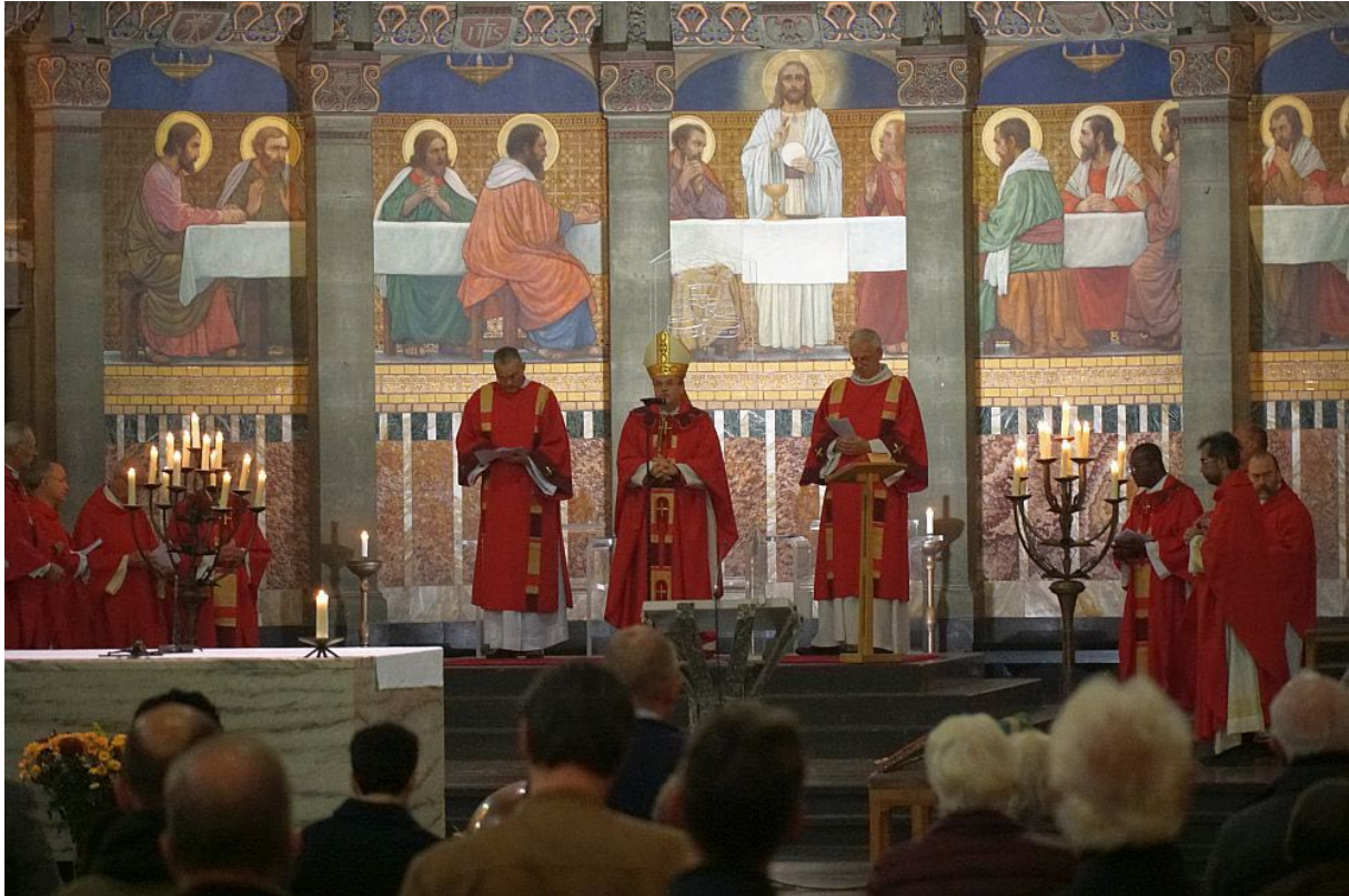
Synodaliteit: Meewerken aan de opbouw van de Kerk - Homilie openingsviering diocesane fase (17 oktober 2021)