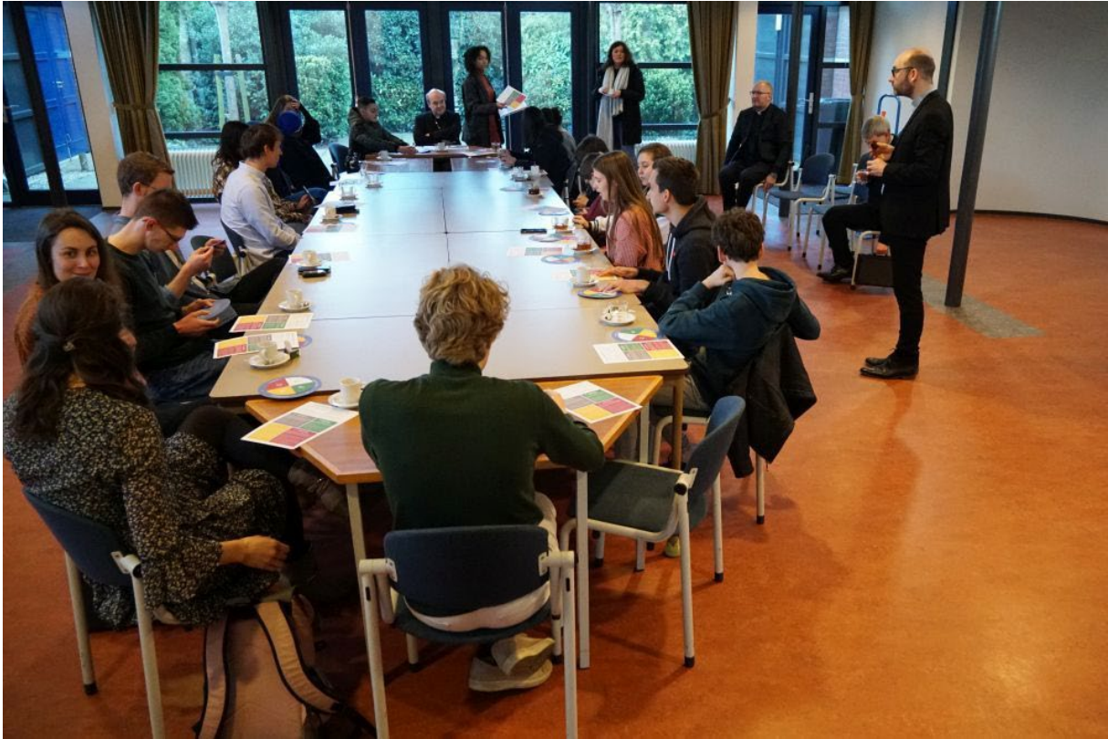
“Voor een synodale Kerk”: Jongeren in gesprek bij de Tour of Faith (27 februari 2022)