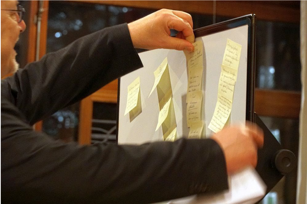
“Voor een synodale Kerk” - parochiebestuurders in gesprek (21 en 22 maart 2022)