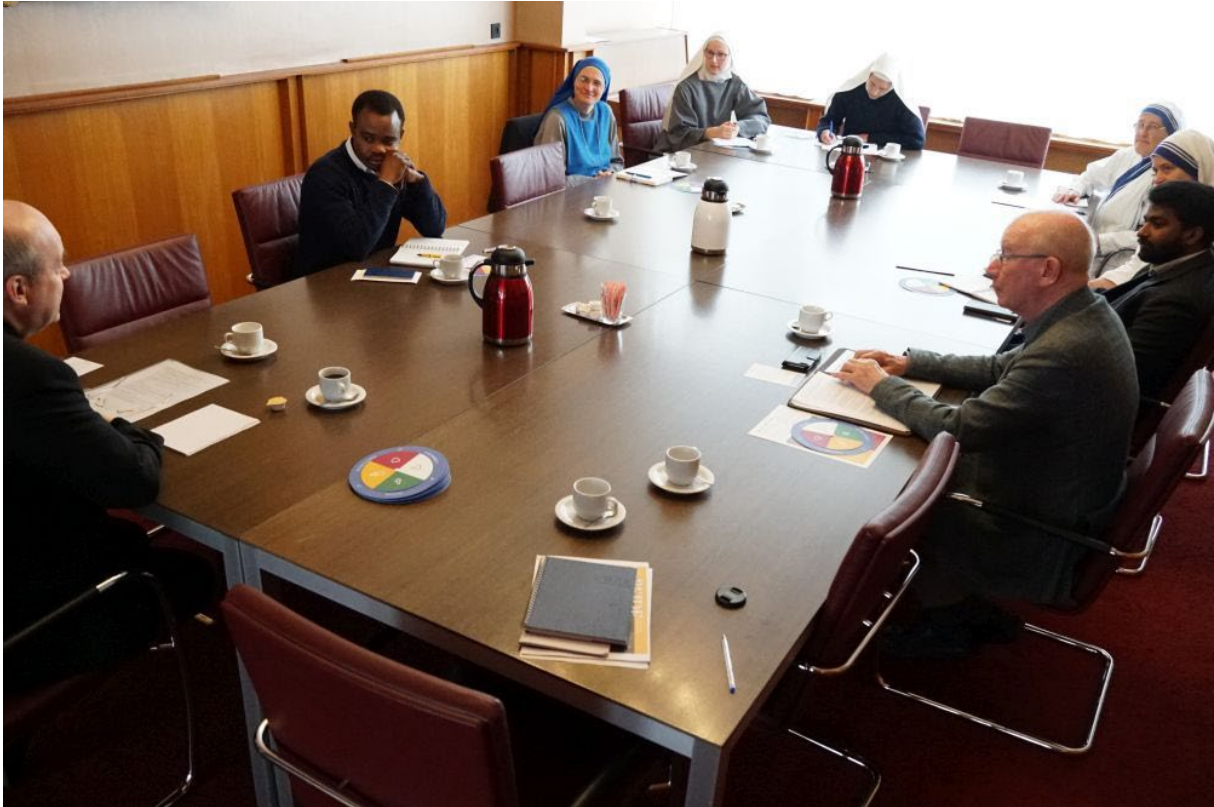
“Voor een synodale Kerk” - Religieuzen in gesprek (30 maart 2022)