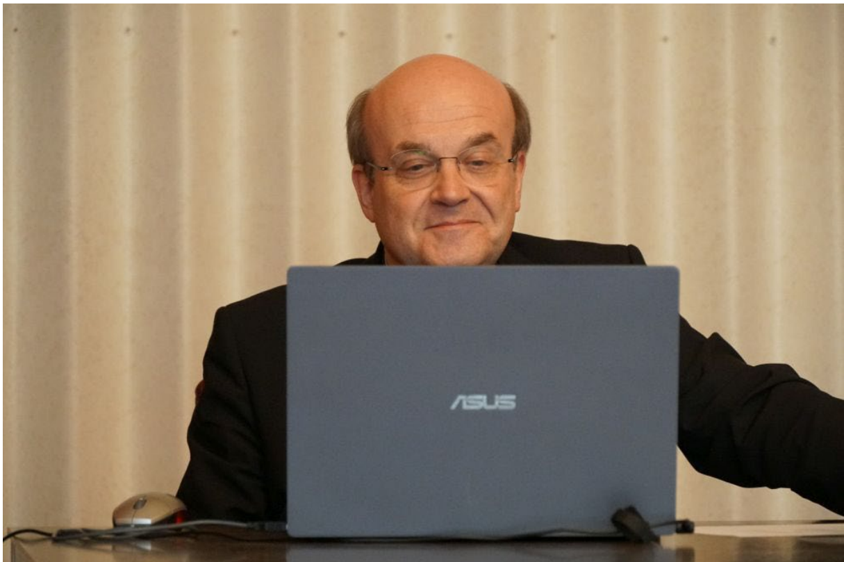
Inleiding bisschop Van den Hende over synodaliteit - In oecumenisch verband (20 januari 2022)