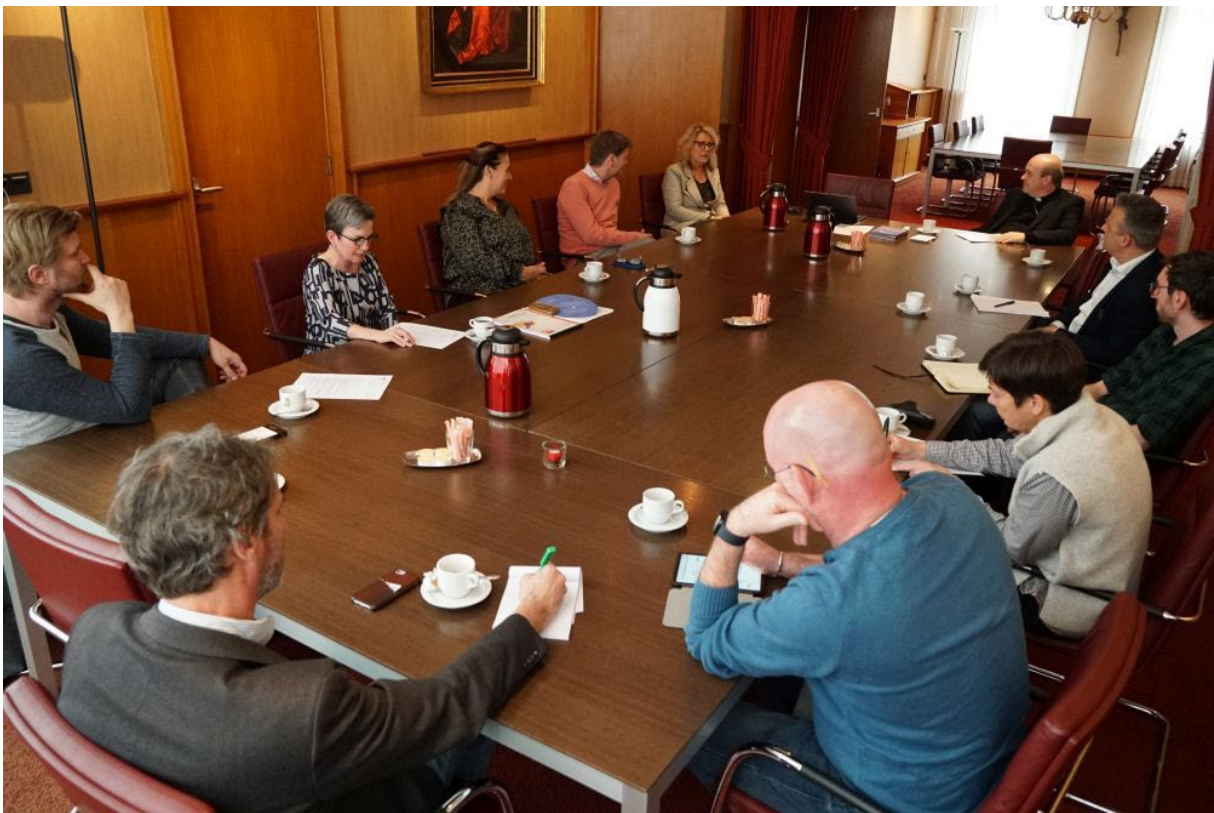
Synode: Bisschop, docenten en schoolleiders in gesprek (14 en 16 maart 2022)