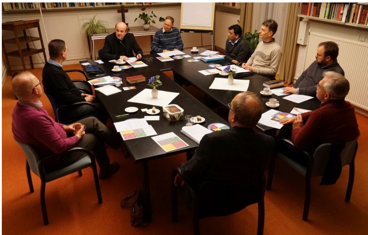
“Voor een synodale Kerk”: Gesprek op Vronesteyn (14 februari 2022)