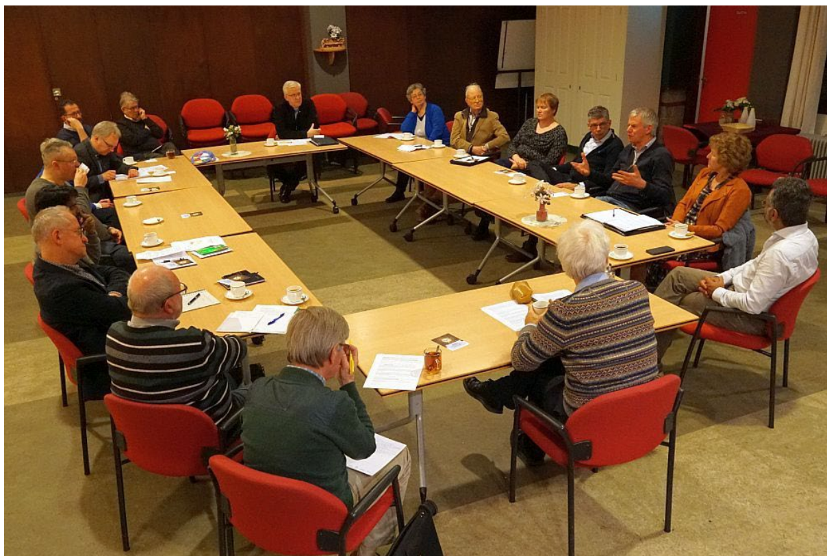
“Voor een synodale Kerk”: Caritas en diaconie (22 februari en 8 maart 2022)